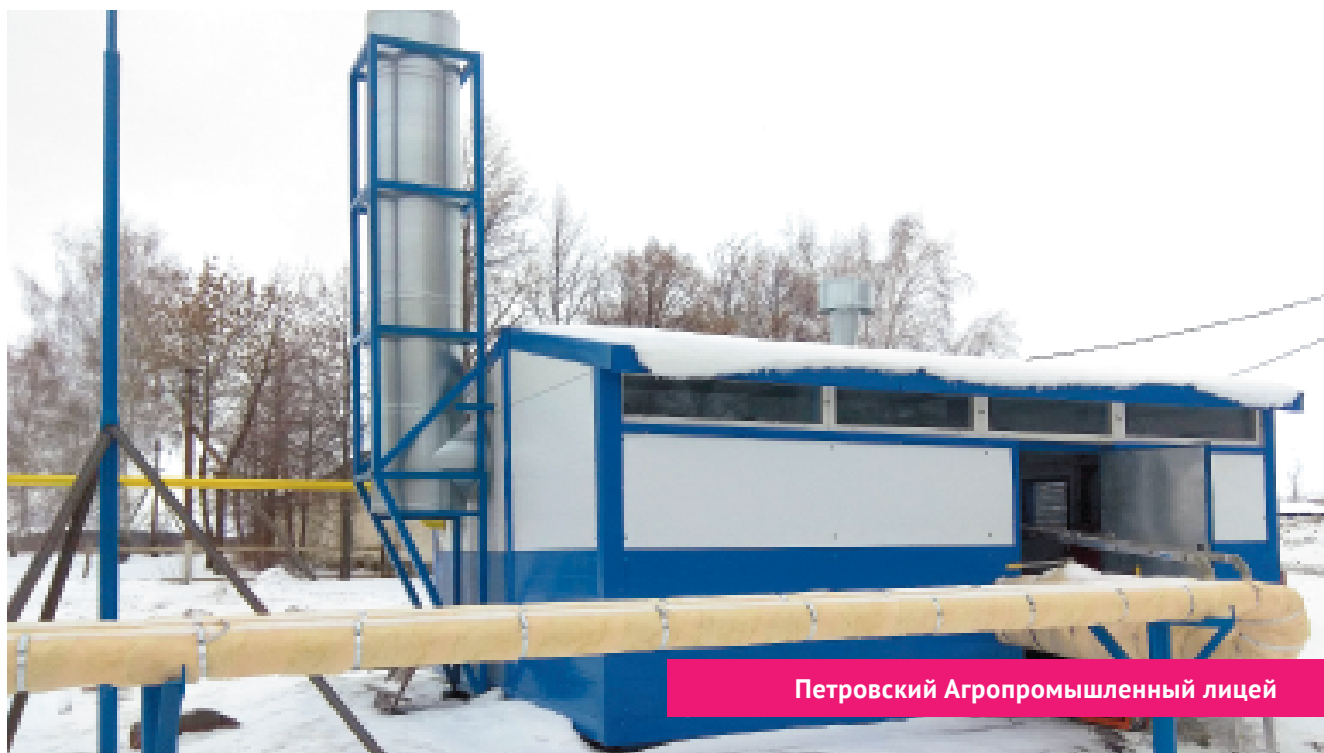
Петровский Агропромышленный лицей

Разработана программа «Энергосбережение и повышение энергетической эффективности Питерского муниципального района на 2021-2030 гг.».