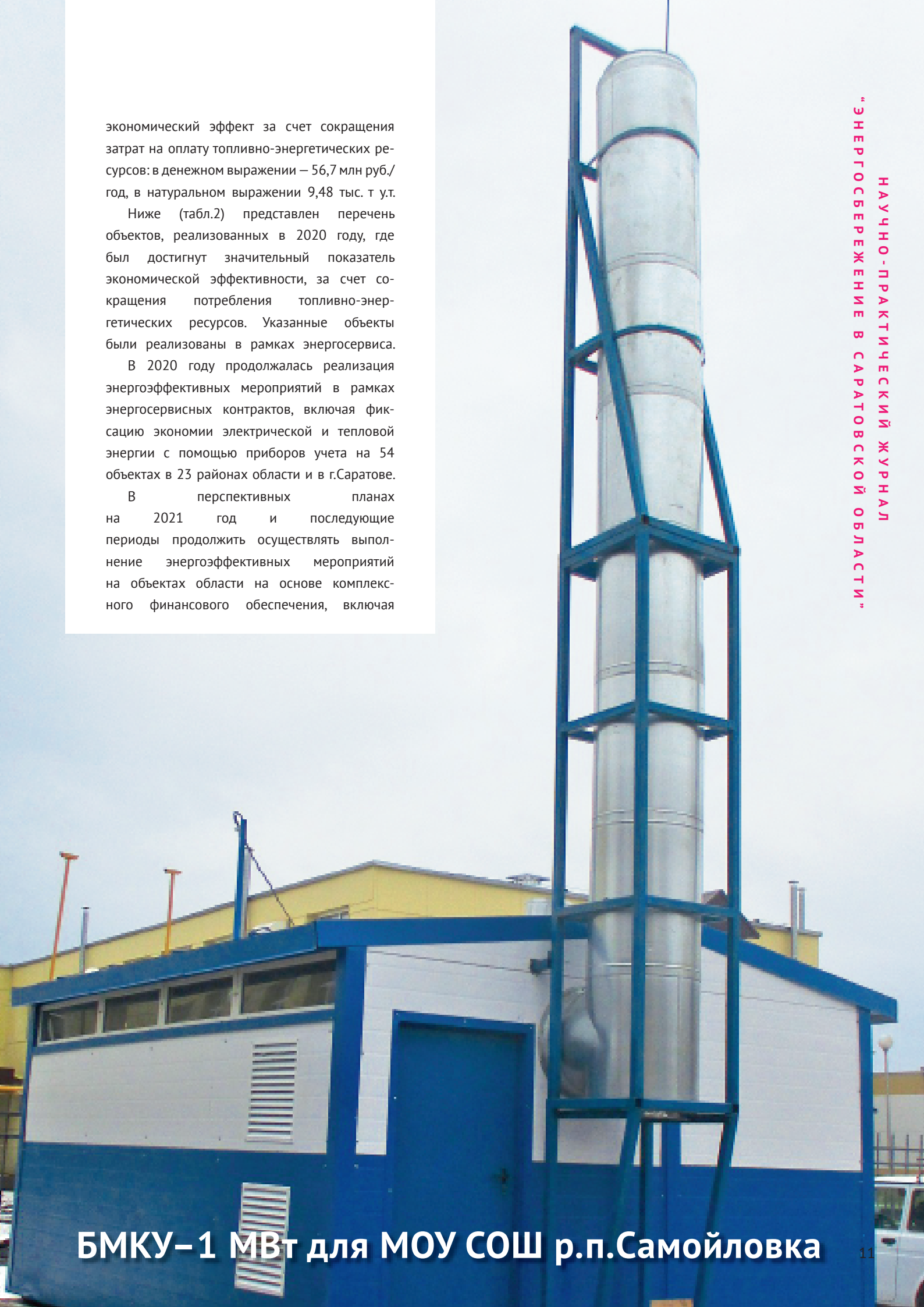
БМКУ–1 МВт для МОУ СОШ р.п.Самойловка

В перспективных планах на 2021 год и последующие периоды продолжить осуществлять выполнение энергоэффективных мероприятий на объектах области на основе комплексного финансового обеспечения, включая