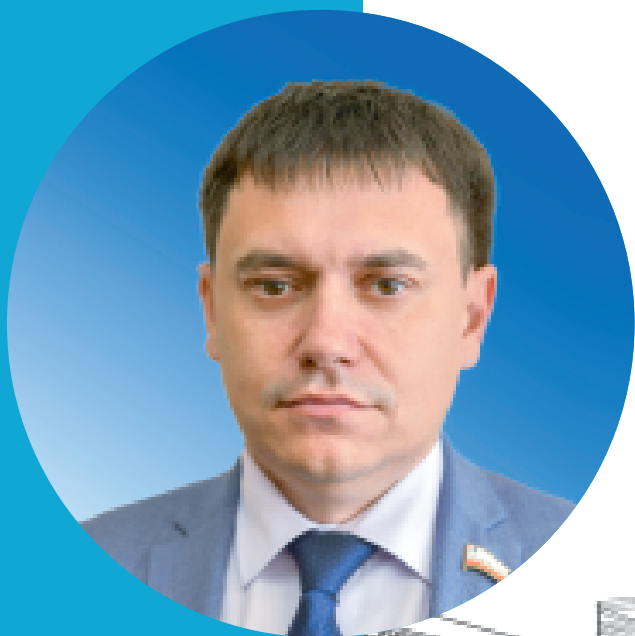
Мигачёв П.В., министр строительства и жилищно-коммунального хозяйства Саратовской области