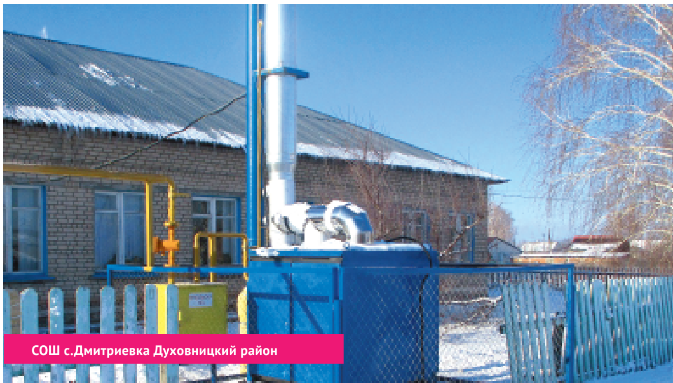
СОШ с.Дмитриевка Духовницкий район

проектно-сметная документация, осуществлена комплектация оборудованием и материалами и установлена солнечная электрическая станция мощностью 45 кВт. Выработка электрической энергии с 1 октября по декабрь 2020 г. составила – 6915 кВт·ч.