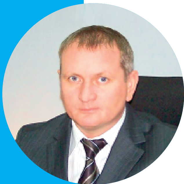
Муравьев Д.А., первый заместитель министра экономического развития Саратовской области

Инвестиционный портфель масштабирован до 168 крупных проектов, в рамках реализации которых было создано 900 новых рабочих мест, из них завершили реализацию 35 инвестиционных проектов, наиболее крупные: -мясохладобойня ООО «Свинокомплекс